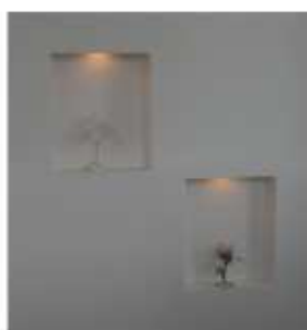
階段踊場のニッチ