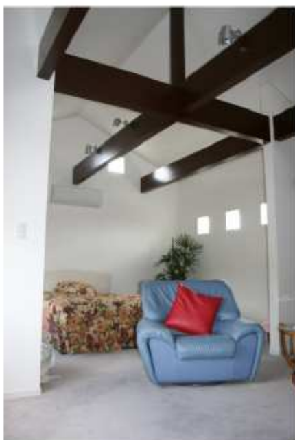
若夫婦のためのベッドルーム