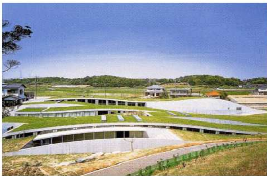
新美南吉記念館 愛知県半田市岩滑