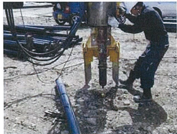
杭芯ずれ防止アタッチメントを使用し、杭打接地点に正確にセット

4 月 26 日（木）理事会前の勉強会 に参加します。 支部事務局 Fax 0745-71-2311