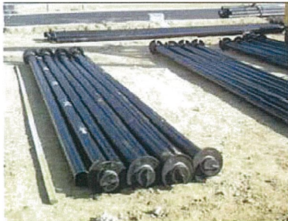
現場に並べられた鋼管杭