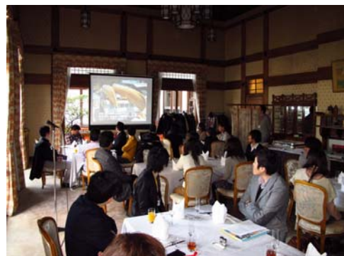
（昨年度の見学会及び祝賀会の様子）