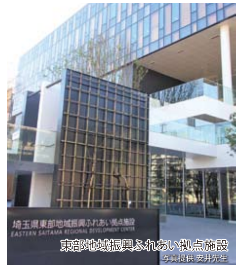
埼玉東部地域振興ふれあい拠点施設 EASTERN SAITAMA REGIONAL DEVELOPMENT CENTER 東部地域振興ふれあい拠点施設