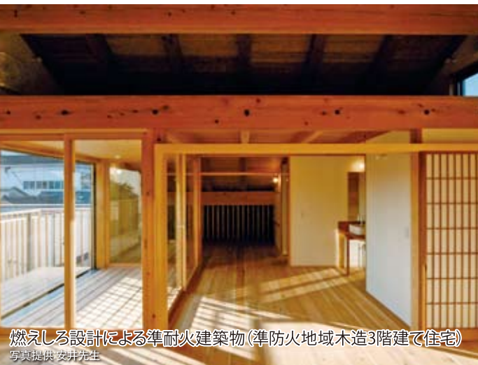
燃えしる設計による準耐火建築物(準防火地域木造3階建て住宅)