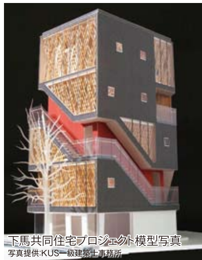
下馬共同住宅プロジェクト外模型写真 写真提供 KUS一級建築士事務所