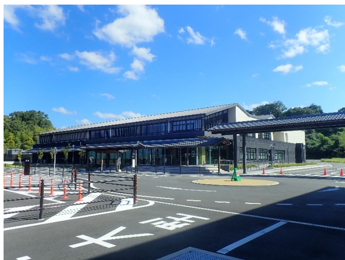
文化財修復・展示棟 外観(南西面)

初めに文化財修復・展示棟を見学しました。文化財修復・展示棟では、仏像や絵画・書跡等の修復作業が行われていました。また、修復作業に使われる道具類の展示もありました。特にB1階については、写真撮影が禁止されており、修復作業は非常に繊細なものだと感じました。また、B1階は天井を高くしており、仏像等を運搬するためのクレーンがありました。さらに、クレーンからの振動が伝わらないよう2重床にするなどの工夫がされていました。