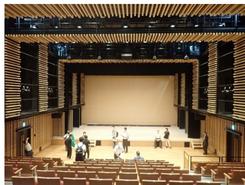
芸術文化体験棟 B1階ホール

次に、芸術文化体験棟の見学を行いました。初めにB1階のホール、次に3階へ行きラウンジやテラス、研修室などを見学しました。ホールはB1階~1階となっており、座席数も272席と大空間になっていました。また、3階のテラスからは周辺の建物や山なども見わたすことができ、休憩するのに良いと思いました。ただ、手摺りがガラスだったため、少し怖さを感じました。