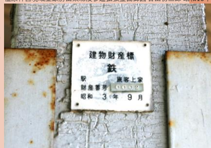
畝傍駅の建物財産標（鉄 旅客上家 0002 昭和3年9月）