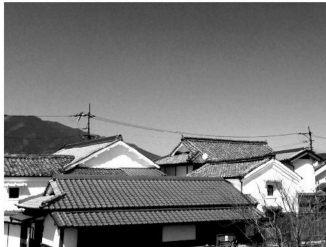
五條新町の瓦屋根