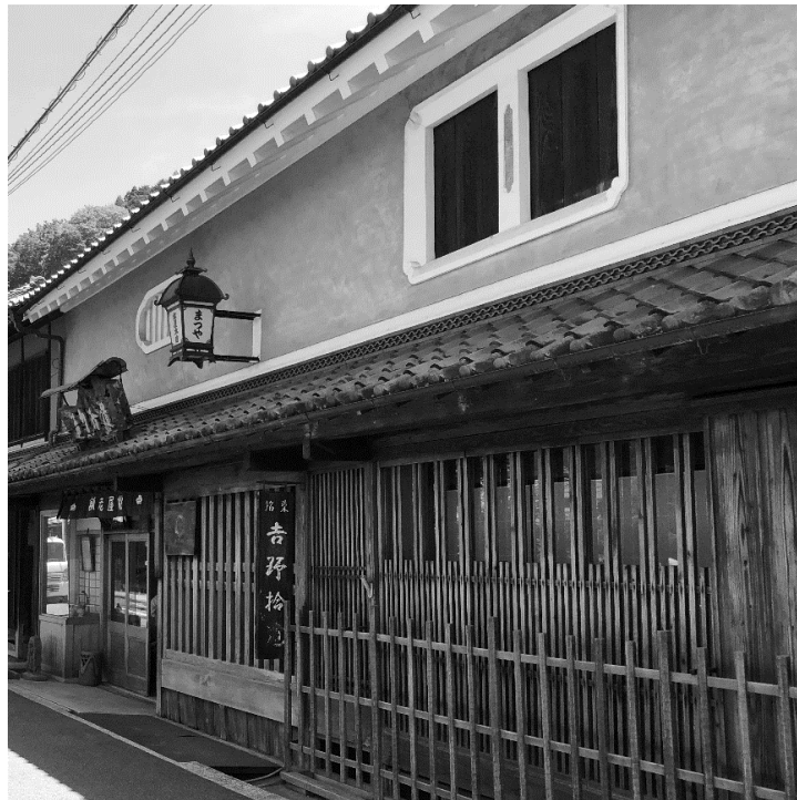
春の見学会 松屋本店