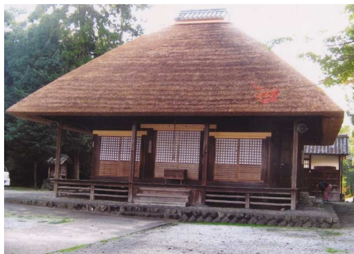
五條市大津町 念仏寺陀々堂