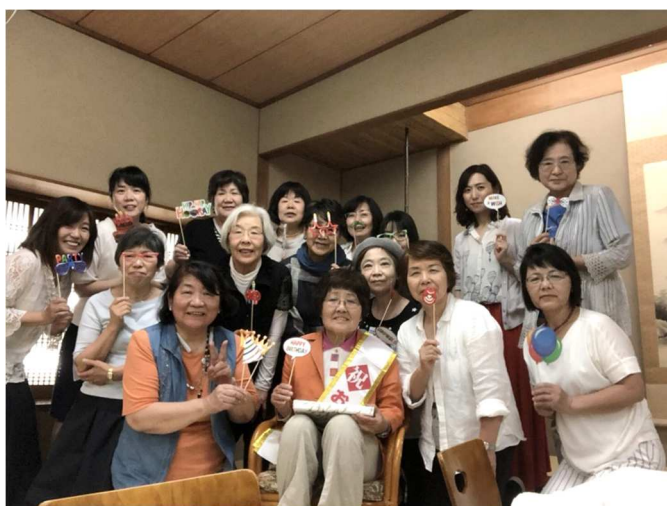
終身会員 祝賀会にて

もうちょっと仕事をしたいが、もう辞め時だと思う。来年5月には車の免許更新だ。高齢者の事故が多いので免許証返納も・・・。