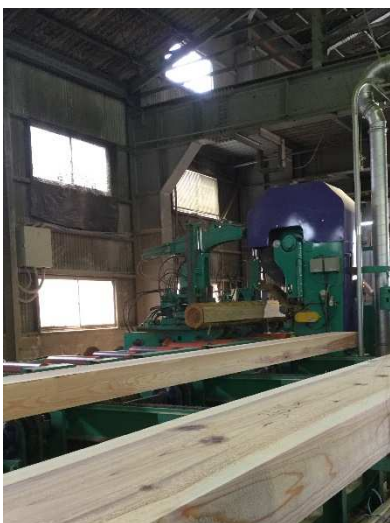
帯鋸製材機（高速製材機）