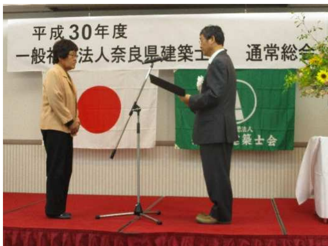
終身会員 表彰式 総会にて

昭和 32 年に吉野工業高等学校建築科を卒業以来、ずっと仕事を続けてこられて、感謝の気持ちでいっぱい。経済成長もあり、技術が発達していった良い時代だった。T 定規と三角定規の時代からドラフターになり、今はコンピューターだ。もうついていけない。図面はもう描けないし仕事もないので設計事務所は閉じ、今は椋本工務店で現場監理をしている。会社は文化財の建物を手がけている。茅葺屋根だ。安堵町の中邸や五條市大津町の念仏寺陀々堂・・・など。茅は青森県産。中邸では、京大農学部の先生やインドネシア大学の先生まで見学にこられ、日本の葺き方はきれいだとほめて下さった。日本人は手先が器用だ。