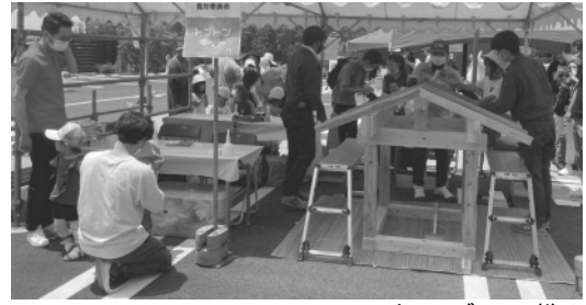
トントンキットブースの様子

多数の出店依頼を頂いており、10月2、3日には、イオンモール大和郡山で開催される『ならの木づくりフェスタ』に出店する予定です。