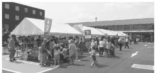
体験ブースが建ち並ぶ様子