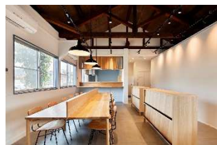
駅中食堂ピクトン