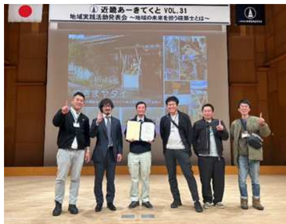
奈良会が最優秀賞を受賞！